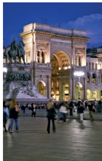
Wejście do Galleria Vittorio Emanuele II

Najsłynniejsza sala operowa we Włoszech, wzniesiona w latach 1776–78 r. może nieco rozczarować, jeśli ograniczymy się do podziwiania jej neoklasycystycznej fasady projektu Piermariniego, eleganckiej, ale banalnej. Budynek został ostatnio gruntownie odrestaurowany, bardzo kosztowne prace renowacyjne prowadził m.in. architekt Mario Botta, który rozbudował kulisy, nadając budynkowi nowy, bardziej oryginalny kształt. Wspaniała sala w formie podkowy zachwyca swoim ogromem (może pomieścić 3600 widzów) i wyjątkową akustyką, gdyż artystów słychać doskonale nawet z najwyżżej położonych miejsc.