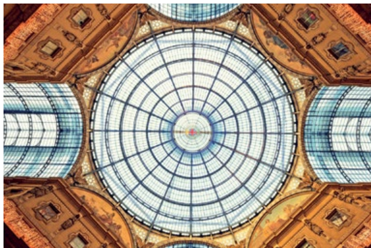
Kopuła Galleria Vittorio Emanuele II

Legendarny mediolański pasaż, otwarty w 1877 r., przypomina swym kształtem ogromny krzyż, nad którym rozpościera się kopuła ze szkła i stali zawieszona na wysokości 50 m. W pasażu mieszczą się sklepy, kawiarnie i restauracje. Wokół jednej z mozaik zdobiących posadzkę zbierają się grupki przechodniów. Zgodnie ze zwyczajem należy postawić stopę na mozaice przedstawiającej byka i, trzykrotnie obracając się na pięcie, rozgnieść przyrodzenie byka przedstawionego na herbie rodziny sabaudzkiej – podobno przynosi to szczęście. W głębi widać piazza della Scala.