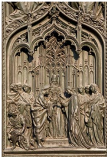
Misternie zdobione drzwi katedry

Dawny pałac królewski został wzniesiony w XVIII w. wg projektu Giuseppe Piermariniego , zakładającego włączenie do budowli licznych gotyckich pozostałości starego pałacu książęcego. Na szczególną uwagę zasługuje pokazna Sala delle Cariatidi (Sala Kariatyd), niewyremontowana od czasów wojny. W pałacu organizowane są wielkie wystawy sztuki.