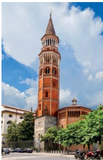
Chiesa di San Gottardo

Ta dawna kaplica książęca, do której można dojść malowniczą via del Palazzo Reale, została zbudowana w 1366 r. Na szczególną uwagę zasługuje ośmioboczna, wysoka dzwonnica ★ w stylu gotyckim. Wewnątrz kościoła (na ścianie w głębi po lewej stronie) widoczne są ślady malowidła przedstawiającego scenę ukrzyżowania, wykonanego w stylu inspirowanym dziełami Giotta.