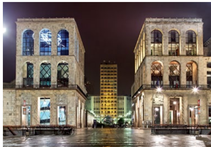
Museo del Novecento

Po długotrwałych pracach renowacyjnych w Arengario, zbudowanym w 1930 r. wg projektu Portaluppiego, Muzia, Magistretti i Griffini, otwarto muzeum poświęcone sztuce XX w. Zwiedzanie muzeum najlepiej rozpocząć od podziemi (Metro Duomo), a potem wejść na wyższe piętra schodami przypominającymi te w nowojorskim muzeum Guggenheima. Kolekcję otwiera dzieło Dwóch pływaków z grupy Cudowne kąpiele Giorgia de Chirico, ale największym skarbem w zbiorach jest Quarto Stato . Obraz, namalowany w 1901 r. przez Giuseppe Pellizza da Volpedo, przedstawia z niebywałą siłą wyrazu grupę robotników i wieśniaków w drodze do miejsca, które ma być spełnieniem ich marzeń. Dzieła prezentowane są w sposób chronologiczny, podzielone na sekcje ukazujące wielkie prądy XX w., aż do Arte Povera,