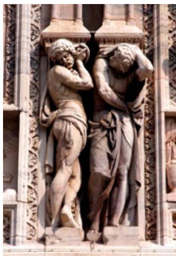
Detale architektoniczne Duomo